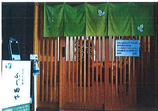
～ビルの1階とは思えない店構え～