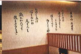
壁に書かれた「独楽吟」