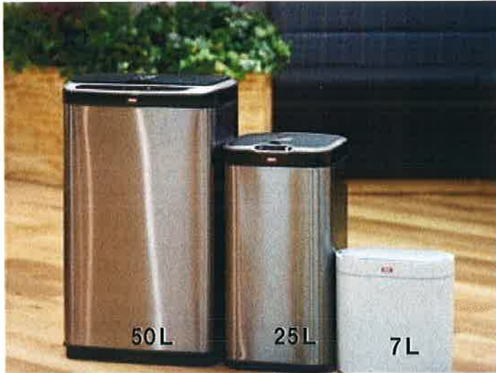
定価 ¥21,780(税込) 定価 ¥15,180(税込) 定価 ¥6,578(税込)