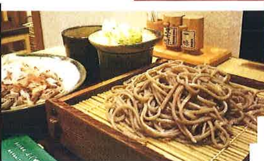
お得なもり・おろし二枚そばセット