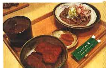
絶品！黒龍吟醸ソースかつ丼

今回は知る人ぞ知る、隠れた名店の「手打ち蕎麦 ふじ田や」様の紹介です。まず店内に入ると、白木を基調とした、明るい雰囲気のお店造りで、壁には福井の歌人・橘曙覧の「独楽吟」が書かれているのが斬新で印象的でした。